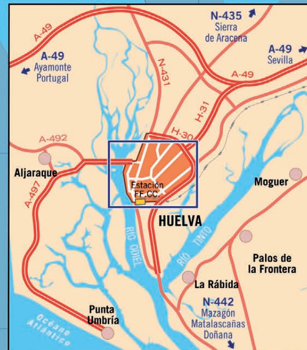
ACCESOS A HUELVA Voies d'accès à Huelva