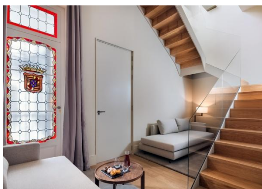
DUPLEX SUITE MIT TERRASSE

Junior Suite mit Terrasse: eine exklusive 70 m 2 große Junior Suite. Der Innenbereich verfügt über eine Fläche von 45 m 2 und umfasst ein Schlafzimmer mit Kingsize Bett (2 x 2 m) oder zwei Einzelbetten (1 x 2 m), einen separaten Wohnbereich mit einer Couch von 0,90 x 1,80 m und eine wunderschöne, voll ausgestattete 25 m 2 große Terrasse. Die Suite besitzt ein 55" Smart TV im Schlafzimmer und ein weiteres im Wohnbereich. Sie bietet Platz für bis zu 3 Personen.