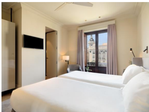
DOPPELZIMMER PLAZA TENDILLAS

Doppelzimmer mit Blick auf den Innenhof: 22 m 2 große Zimmer, die mit einem Kingsize Bett (2 x 2 m) oder zwei Einzelbetten (1 x 2 m) ausgestattet sind. Sie bieten einen Blick auf den Atrium oder auf den begrünten Innenhof mit Plunge Pool und sind für die Unterbringung von bis zu 2 Personen geeignet.