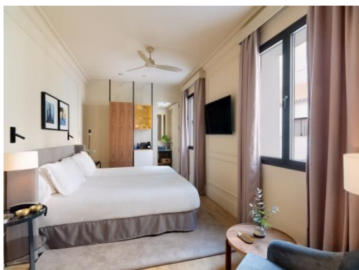
DOPPELZIMMER MIT BLICK AUF DEN INNENHOF

Bad mit professionellem Haartrockner, Regendusche, japanischem WC und Vergrößerungsspiegel