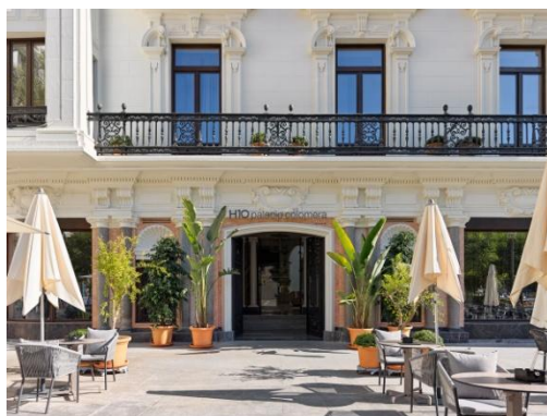
CAFETERIA MIT TISCHSERVICE AUF DER PLAZA DE LAS TENDILLAS