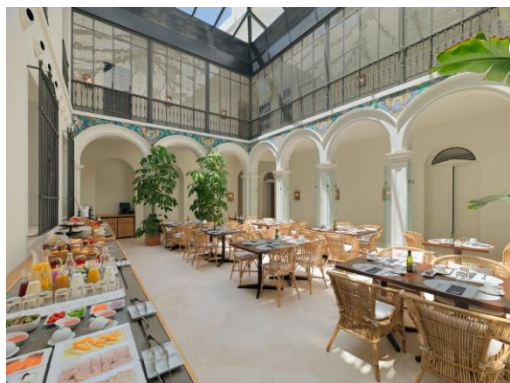
RESTAURANT POUR LE PETIT DÉJEUNER

Rooftop Bar : situé sur une terrasse panoramique au dernier étage du bâtiment, il offre des vues spectaculaires sur la Plaza de las Tendillas et la mosquée-cathédrale de Cordoue. Le rooftop bar propose une carte de plats légers et de cocktails.