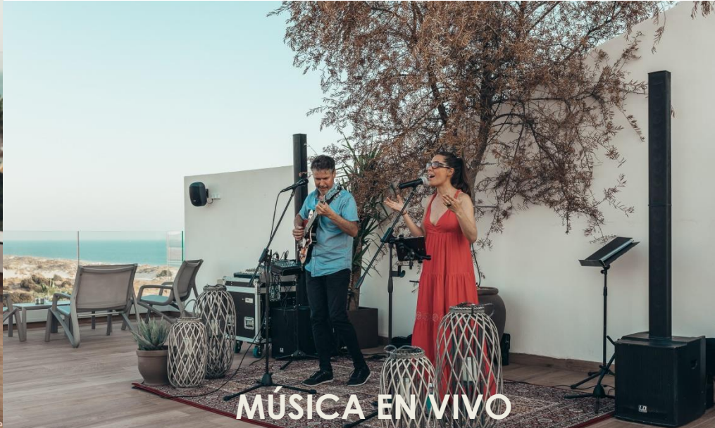
MÚSICA EN VIVO