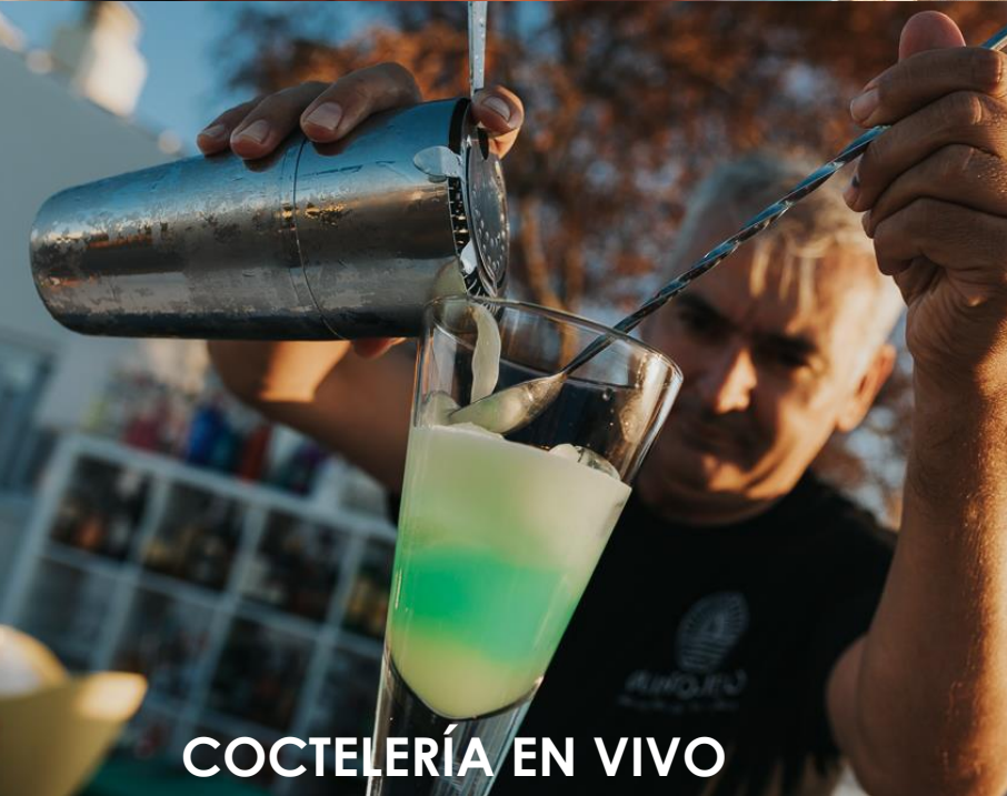
COCTELERÍA EN VIVO