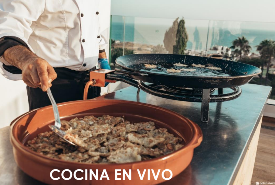
COCINA EN VIVO