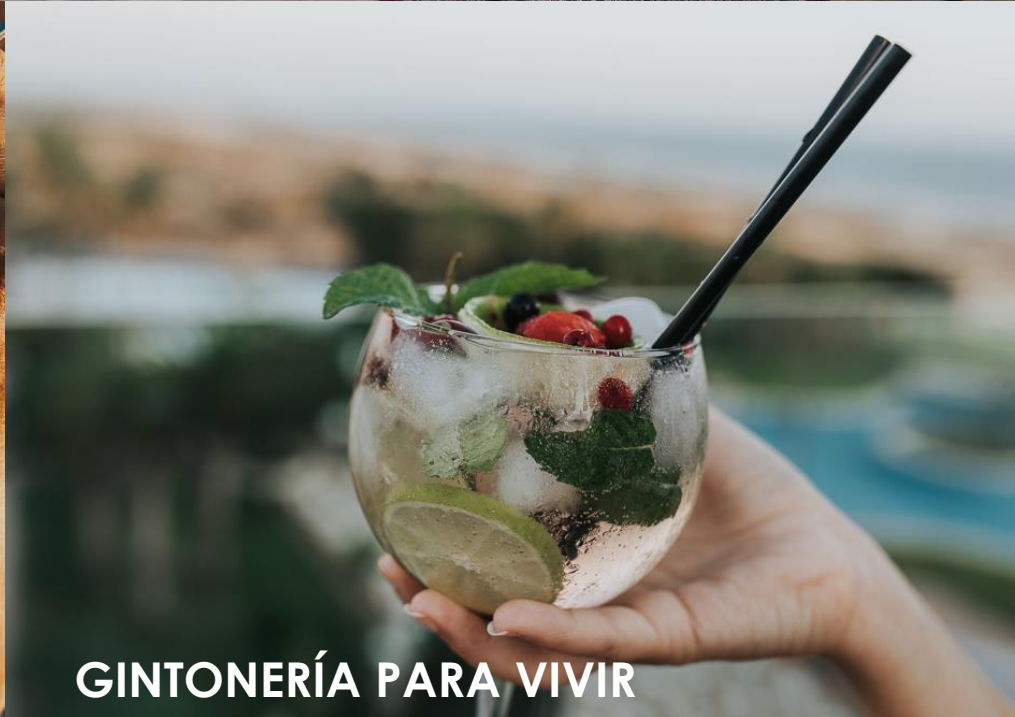
GINTONERÍA PARA VIVIR