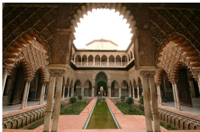
De Cat from Sevilla, Spain - Patio de las Doncellas.

Nota: Descuento por uso de vehículo propio 140 €