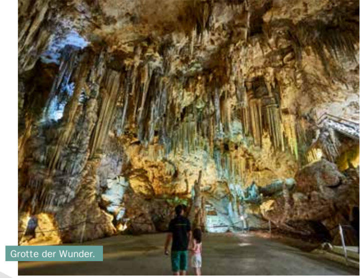
Grotte der Wunder.

Ohne die Koffer Ein- und Auspacken zu müssen haben Sie alles, was Sie brauchen, um völlig autonom zu sein. Sie sind nicht von festen Zeitplänen abhängig und können bei Bedarf improvisieren. All dies macht den Wohnmobiltourismus zu einer idealen Option für Reisen mit den Kleinen. Auf ins Abenteuer!