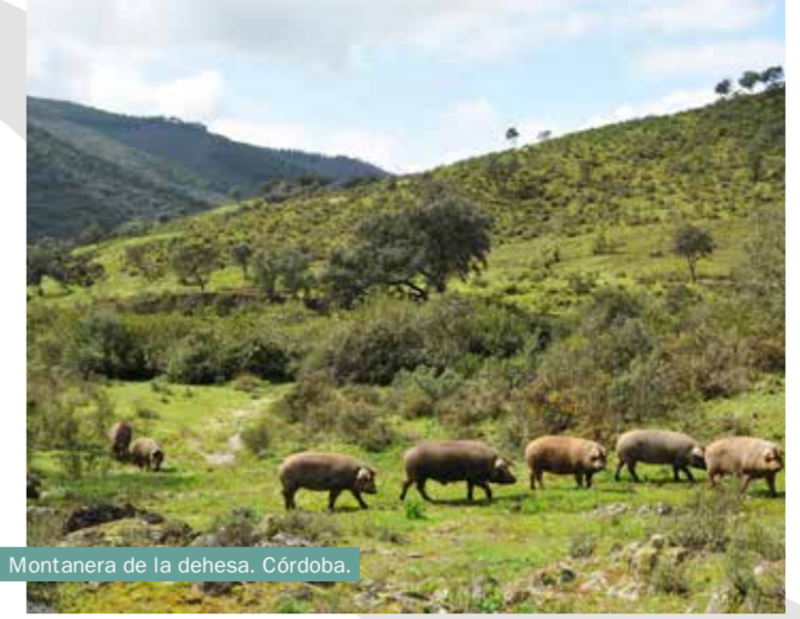
Montanera de la dehesa. Córdoba.

Das Caravanning fördert einen weniger invasiven und humaneren Tourismus , der den kulturellen Austausch fördert und dem Reisenden lokale Bräuche und Traditionen näher bringt. Es wird Ihnen nicht schwer fallen, die Handwerker in ihren Werkstätten zu sehen und an ihrer Arbeit teilzunehmen: Ton, Schmieden, Espartagras oder Leder. Darüber hinaus können Sie je nach Jahreszeit, in der Sie reisen, während der Montanera eine Herde iberischer Schweine „grasen“ , nach den Segureña- Schafen wandern , in den Wald gehen, um Pilze zu sammeln, ein hervorragendes Extra natives Olivenöl probieren, Kastanien pflücken oder nach der Weinlese am Erntedankfest teilnehmen . Profitieren Sie und kaufen Sie lokale und ökologische Produkte ; Sie helfen so der lokalen Wirtschaft. Und wenn Sie auf die Agrotourismus-Erlebnisse setzen und voll in die ländliche Umgebung eintauchen, wagen Sie es handwerklichen Käse herzustellen, kneten Sie gutes Brot und sammeln Sie Honig. Oder Sie setzen sich einfach neben den Kamin oder auf eine Bank auf Straßenebene, um den Anekdoten, den Lebensgeschichten der älteren Menschen des Ortes zu lauschen.