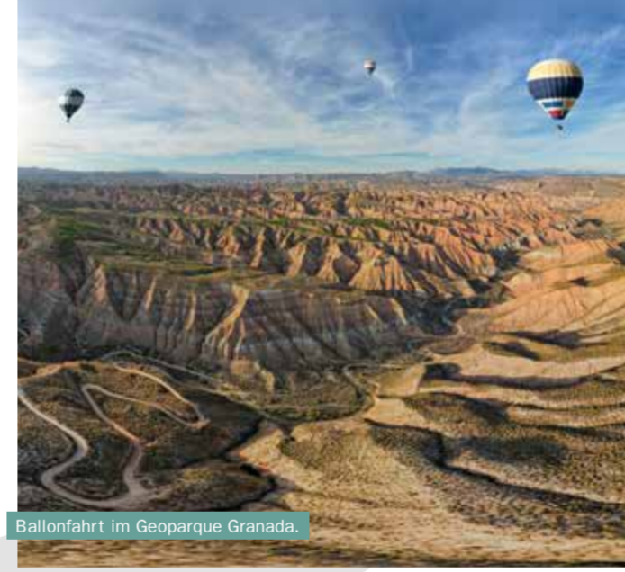
Ballonfahrt im Geoparque Granada.