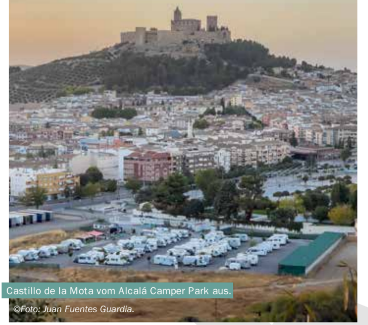
Castillo de la Mota vom Alcalá Camper Park aus.