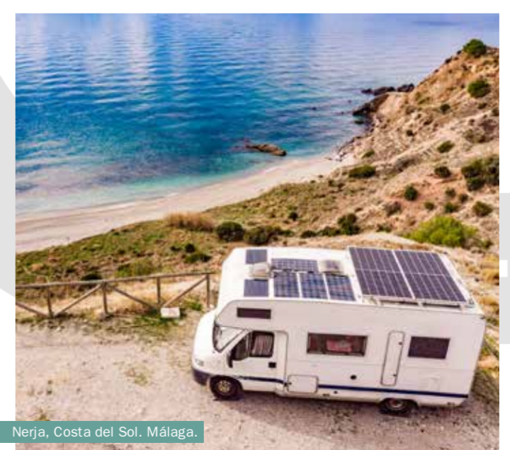
Nerja, Costa del Sol. Málaga.

Und wenn Sie in die maritime Atmosphäre der andalusischen Küstenstädte eintauchen möchten, können Sie ihre Markte voller frischer Fische besuchen, frisch ausgeladen, um an einer Live-Auktion teilzunehmen. Sie können auch die uralte Kunst der Almadraba aus erster Hand kennenlernen oder zu einer der Salinen und Mündungen der Bucht von Cádiz und Huelva gehen , wo heute wie in der Vergangenheit handwerkliche Fischerei fortgesetzt wird.