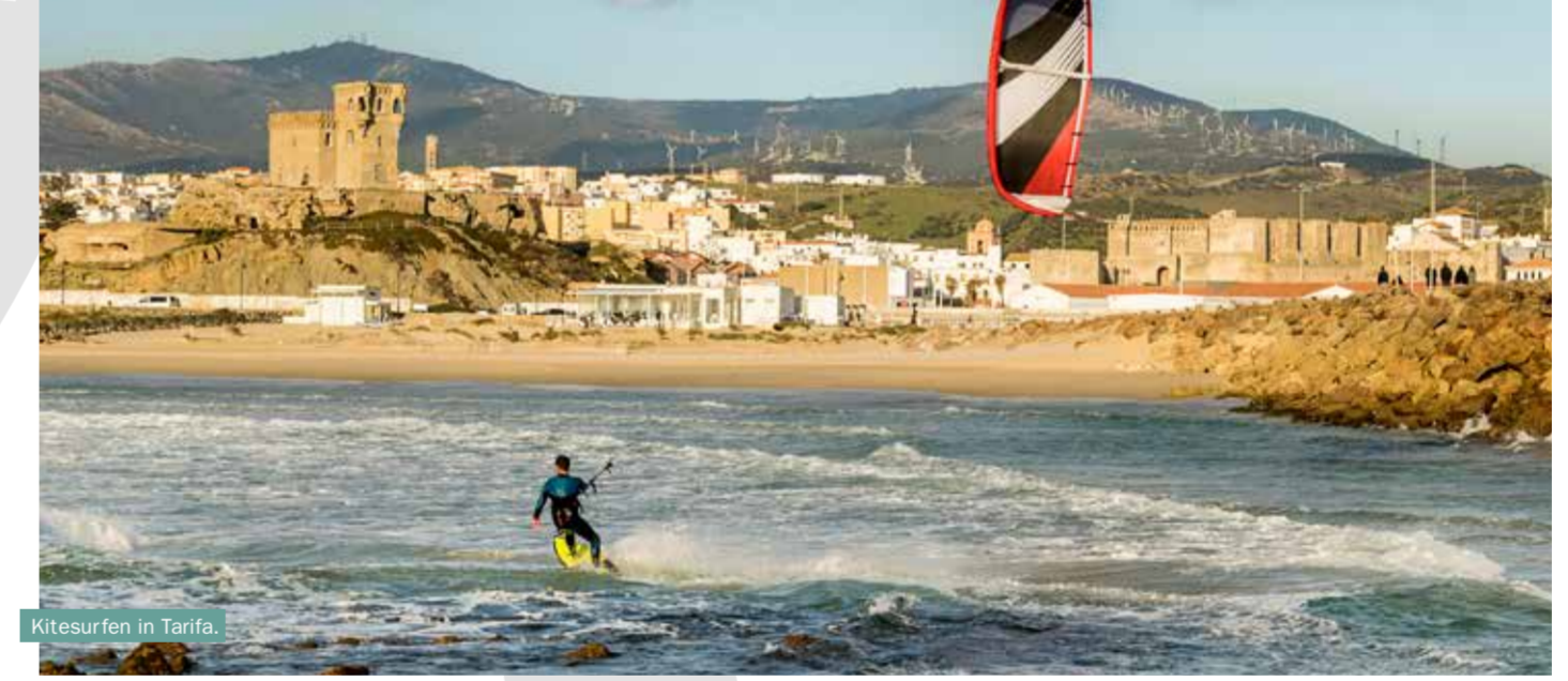
Kitesurfen in Tarifa.